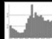
0 à 24 Heures

La forte concentration de la fréquentation les jours et horaires de bureau dénote du caractère professionnel des visiteurs.